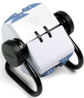
Rolodex.